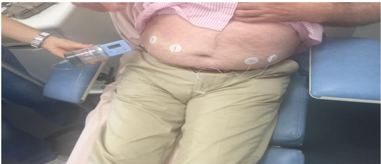
Situation PID 100 avec NERIA Quadruple

1 CRONO S-PID 100 + 1 réservoir CRN 100+ 1 seul Néria quadruple